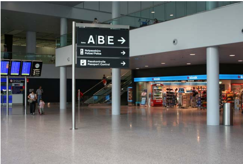
Notpassbüro Ausreise 2