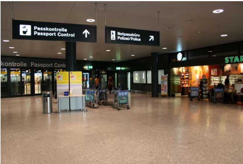
Notpassbüro Ausreise 2, rechts